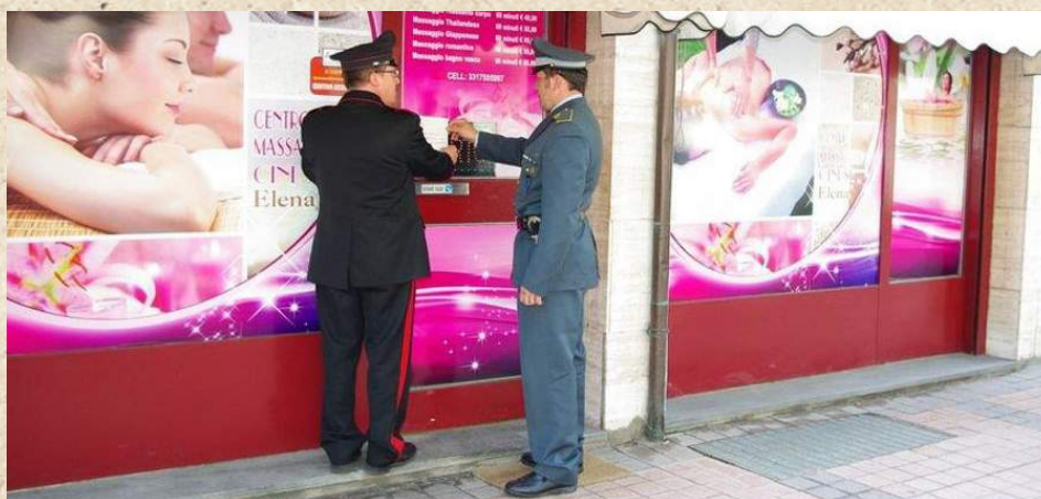
2013 Brescia. Chiusura Centro Massaggi Cinese.