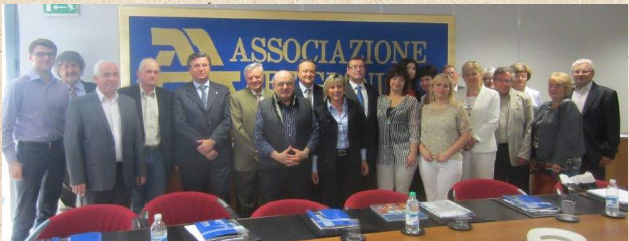
2013 Brescia Sede Via Cefalonia. Delegazione dell'Associazione degli Artigiani di Zory in Polonia.