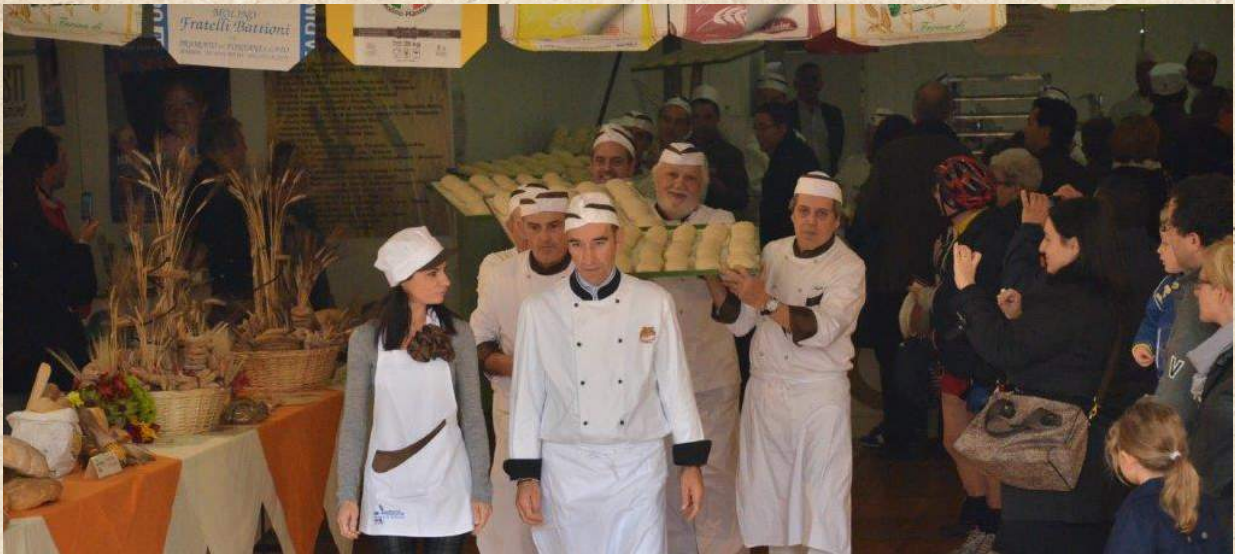
Apertura della Manifestazione.