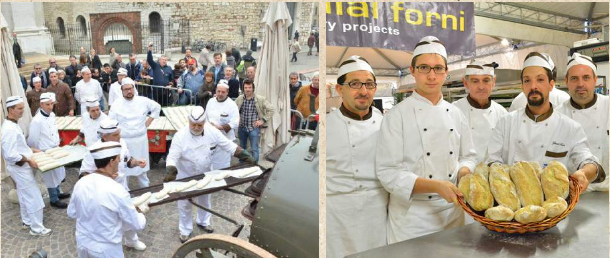
Preparazione del pane nel vecchio forno della Grande Guerra.